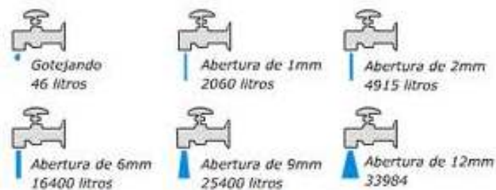
Desperdício de torneiras Litros desperdiçados em 1 dia

Nas piscinas o uso de cobertura reduz as perdas em 90%.